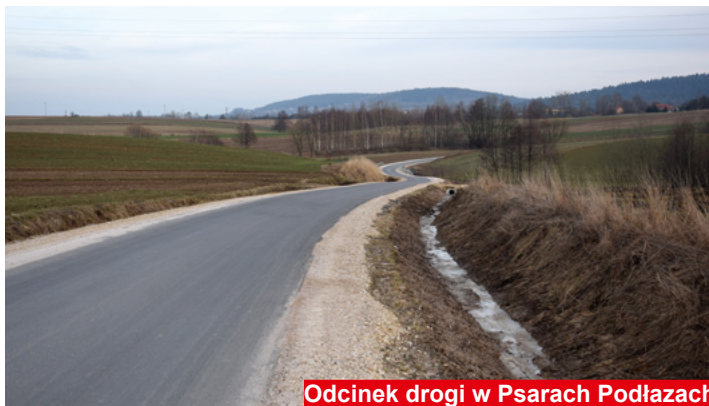
Odcinek drogi w Psarach Podłazach

W gminie Bodzentyn zakończyły się remonty dwóch odcinków dróg powiatowych w miejscowościach Wiącka i Psary Podłazy.