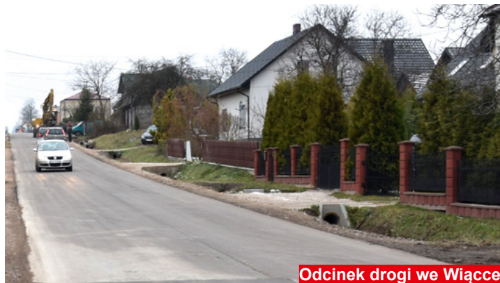
Odcinek drogi we Wiącce