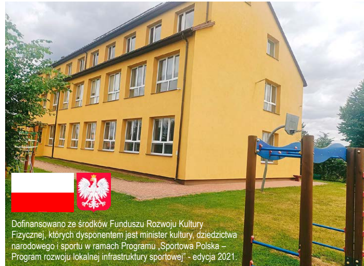
Dofinansowano ze środków Funduszu Rozwoju Kultury Fizycznej, których dysponentem jest minister kultury, dziedzictwa narodowego i sportu w ramach Programu „Sportowa Polska – Program rozwoju lokalnej infrastruktury sportowej” - edycja 2021.

Przedmiotem planowanej inwestycji jest rozbudowa szko-