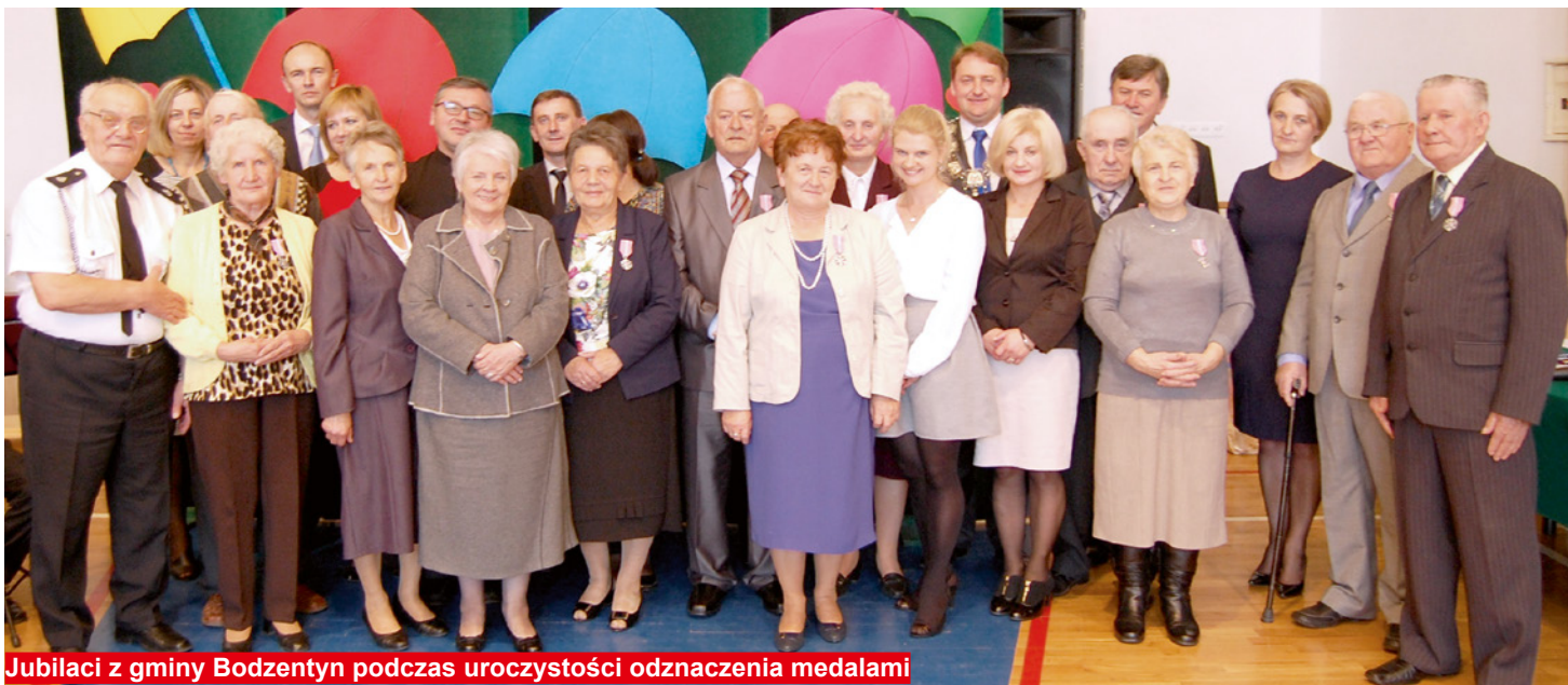
Jubilaci z gminy Bodzentyn podczas uroczystości odznaczenia medalami