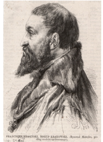
Rysunek: Jan Matejko - Franciszek Krasiński, biskup krakowski

O ogrodach zamkowych na górze i u jej podnóża będących – nad rzeką Psarką – pisano w Niemczech i Szwecji z wielkimi pochwałami tzw.