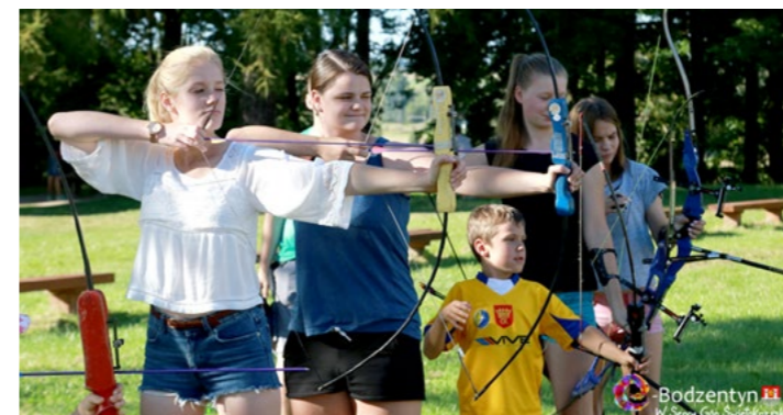
Bodzentyn w Sercu Gai Sycylijskiej

31 sierpnia 2016 roku na placu zamkowym w Bodzentynie odbył piknik łuczniczy. Na zakończenie wakacji Uczniowski Klub Sportowy „Grot Bodzentyn” zorganizował Piknik łuczniczy przy ruinach zamku w Bodzentynie. Ponad dwieście osób w różnym wieku przybyło, by spróbować swoich sił strzelając z łuku. Uczestnicy wzięli udział również w przyjacielskich zawodach między sobą. Dla wszystkich organizatorzy przygotowali pamiątkowe dyplomy i medale oraz kiełbaski i napoje.