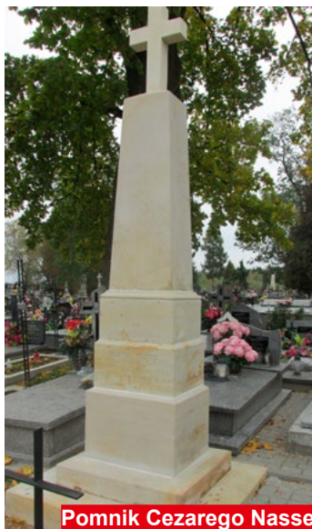
Pomnik Cezarego Nasse